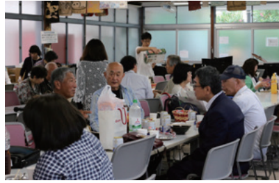
▲ 毎年好評の、豪華景品が当たる抽選会の様子

者への「一言インタビュー」を行わせて頂きました。今年も、30秒で打ち切りのベルが鳴る制限付きです。ベルが鳴っても、まだ話し足りない方も多く、旧友との再会の心の昂ぶりが、そうさせるのでしょう。そして、参加者のお楽しみとなっている懇親会恒例