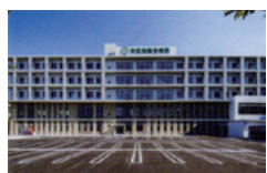
友誼会総合病院 (2018年9月新築移転) 豊川駅 徒歩約10分