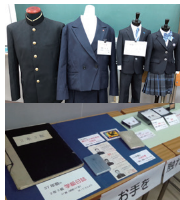
▲懐かしの川高グッズのコーナー