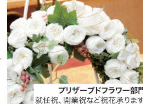
フリーズドライフラワー部門 就任祝、開業祝など祝花承ります。