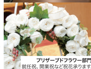
プリザーブドフラワー部門 就任祝、開業祝など祝花承ります。