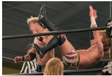
▲生ならではの肉体がぶつかり合う音!