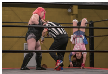
▲お約束その2。たまにシバかれます。