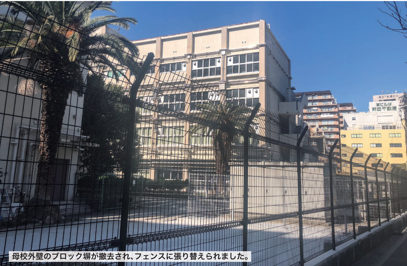
母校外壁のブロック塀が撤去され、フェンスに張り替えられました。