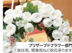
プリザーブドフラワー部門 就任祝、開業祝など祝花承ります。