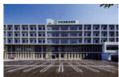
友誼会総合病院 (2018年9月新築移転) 豊川駅 徒歩約10分