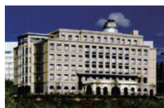
彩都友誼会病院 「彩都西駅 徒歩約5分」

彩都友誼会病院 ☎ 072-641-6898 〒567-0085 大阪府茨木市彩都あさぎ7-2-18