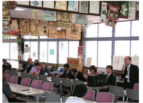
総会・懇親会 平成29年6月18日(日)