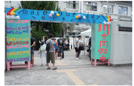
川高祭 平成29年9月2日(土)

「母校の文化祭に同窓会が出店しているの？」 最初聴いた時はびっくりしました。しかし、大勢の仲間たちと「祭」を作る醍醐味が味わえ、同窓生との再会があり、現役生との出会いがある、など貴重な場となっています。