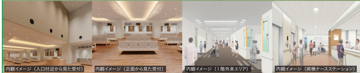
内観イメージ (入口付近から見た受付)