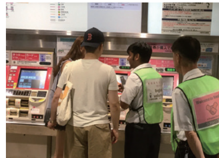
地下鉄ボランティア