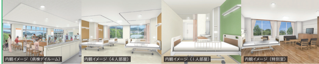
内観イメージ (病棟デイルーム)