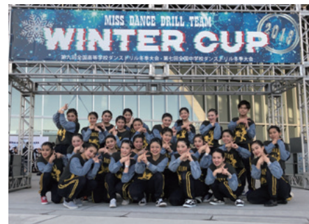
ダンス部 ドリル全国

う思いが強く、11月頃から始まる推薦入試やAO入試などに臨む生徒が多いものの、教員からの働きかけ等により、年明けの一般入試まで粘り強く受験勉強に取り組む生徒も徐々に増えてきています。また、学力とともに自らの考えを整理し、しっかりと自分のことばで発信できるコミュニケーション力や、それぞれの置かれている立場や考え方の違いをはじめ、異文化を理解し、多様な価値観を認める感性についても磨いていく機会等も提供しています。