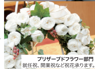
プリザーブドフラワー部門 就任祝、開業祝など祝花承ります。