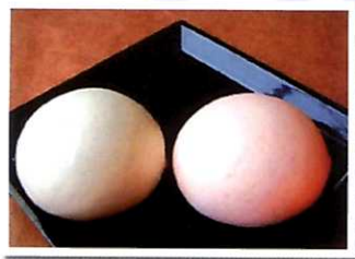
中村製菓・「紅白上用饅頭」

江風会の役員会にて討議した結果、「費用負担は増えるが日本のよき伝統は残していこう。」ということになり、紅白饅頭が卒業式から消えるかもしれないという危機は回避されました。(大嶋)